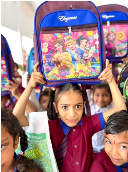
Alla elever på Prem Pathshala fick nya skolväskor.

Bröder och systrar i Kristus, hälsningar i Jesu dyrbara namn