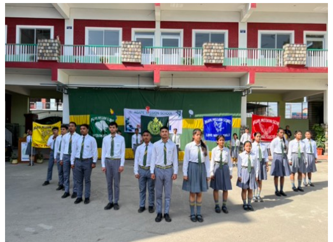
Elever på AMS som blivit ledare för andra.

Vi tror att om frön av kärlek, medkänsla och kamratskap sås redan under skoltiden skall det bära frukt längre fram.